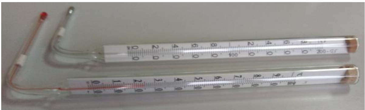
Рисунок 2 - Общий вид термометров технических стеклянных, вид угловой (У)

Пломбирование термометров не предусмотрено.