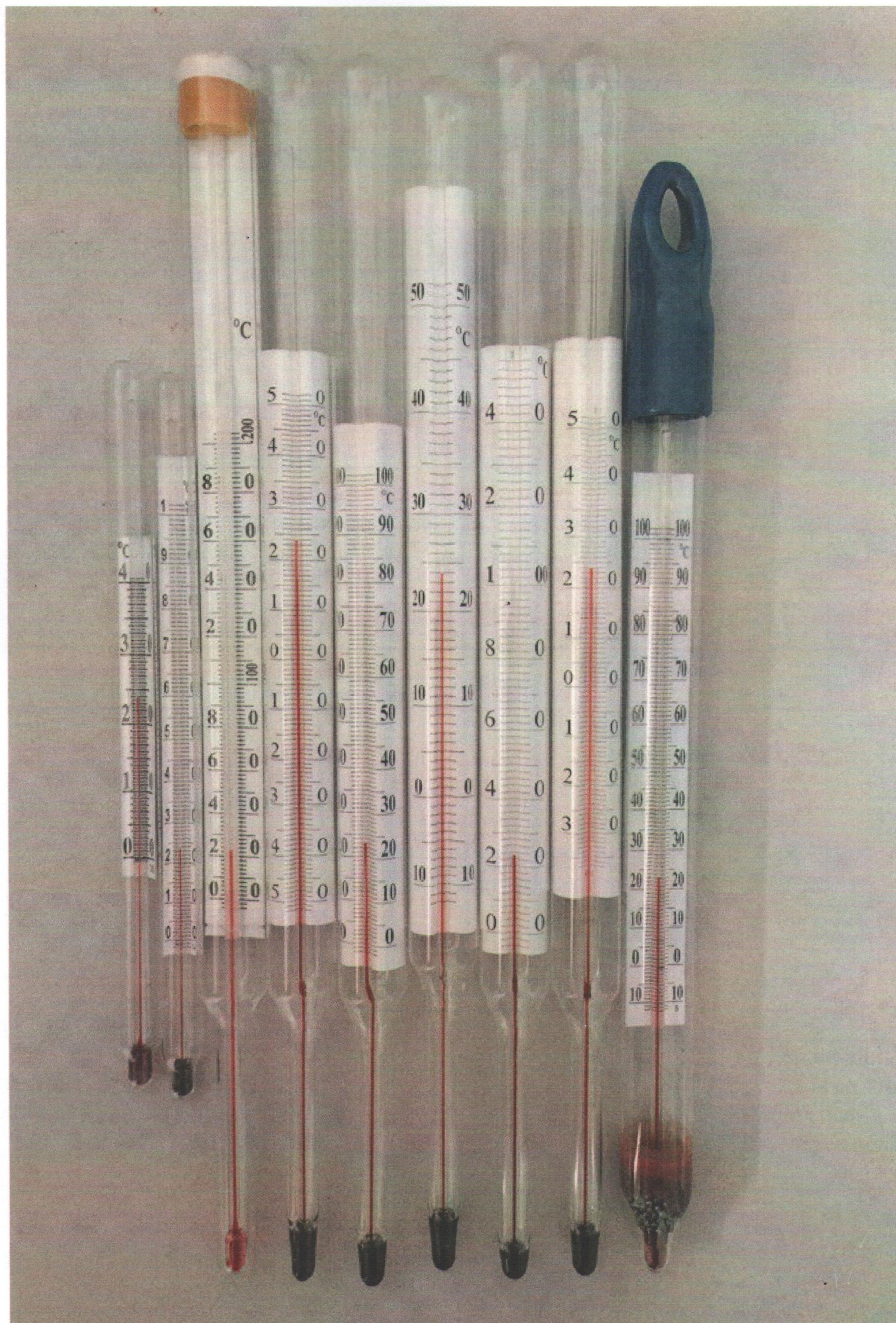
Рисунок 2 - Внешний вид термометров ТТЖ-Т, ТТЖ-СХ, ТТЖ-И, ТТЖ-В